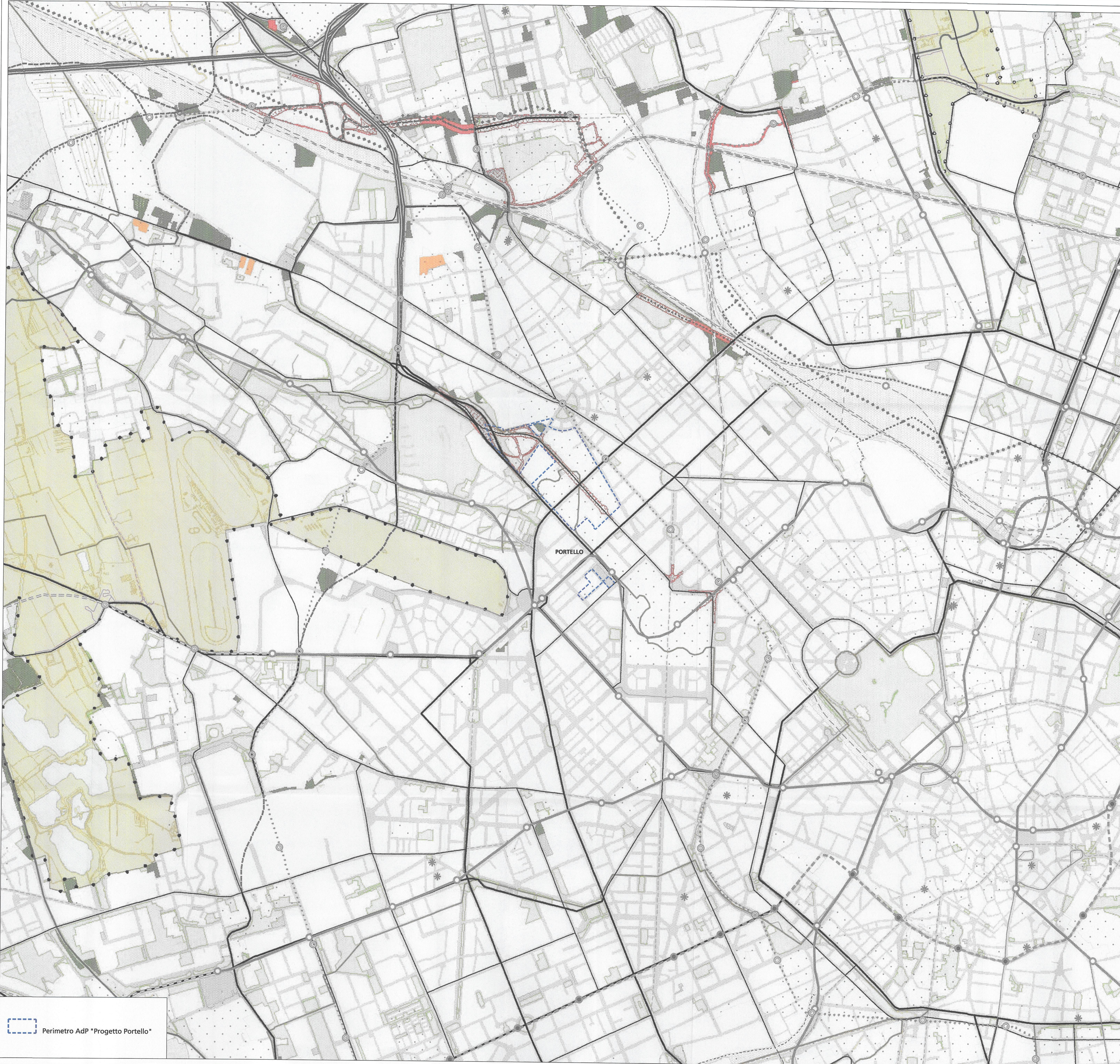
Perimetro AdP "Progetto Portello"

Altri elementi Ambiti interessati da provvedimenti in itinere approvati e adottati (PGR - Artt. 31 e 34)