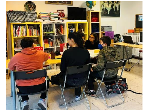
Aiuto compiti al LdQ San Siro