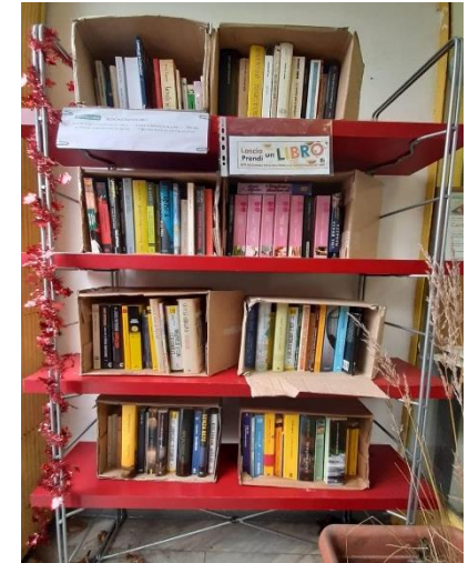
Bookcrossing al LdQ Gratosoglio