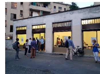
Sede Laboratorio Sociale Lorenteggio