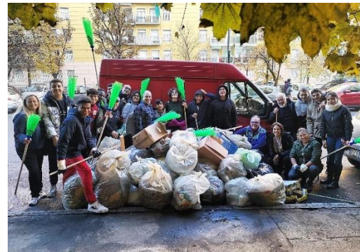
Iniziativa di pulizia spazi pubblici a Gratosoglio