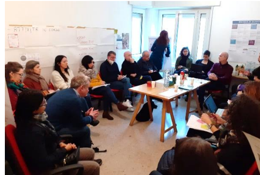
Riunione mensile presso LdQ Ponte Lambro