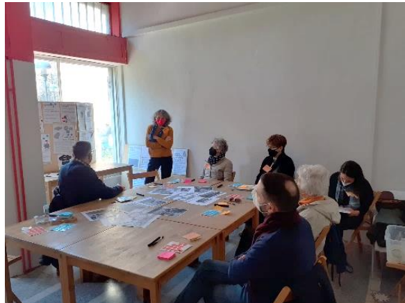
Attività di ascolto abitanti presso LdQ Molise Calvaireate