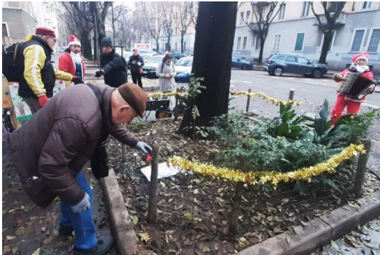
Supporto al Patto di collaborazione Verde Mazzini