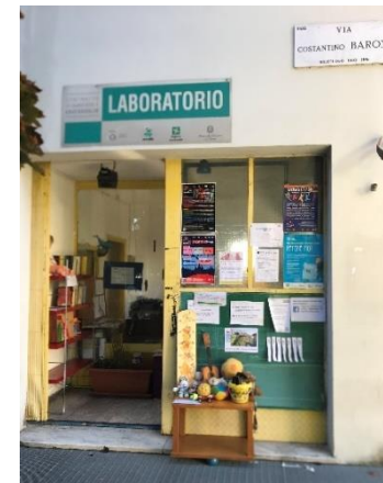
Sede LdQ Gratosoglio

Spazio commerciale al piano terra, con affaccio su strada via Giambellino 150 ang. Segneri (proprietà Aler)