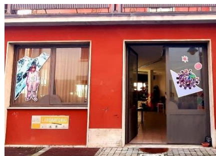
Sede LdQ Mazzini