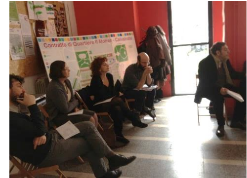
Incontro presso LdQ Molise-Calvairate