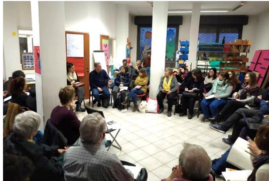
Riunione mensile presso LdQ Mazzini