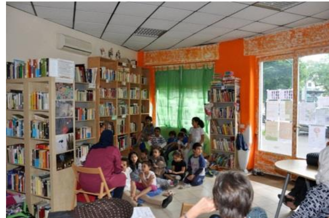
Attività sociali al LdQ San Siro