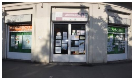
Sede LdQ San Siro

Un aspetto fondamentale del servizio è l'identità della sede del Laboratorio localizzata nel cuore dei quartieri ERP in spazi che ormai sono riconosciuti dalla comunità locale come punto di riferimento per accedere a servizi o per promuovere attività. Le sedi attuali sono: